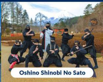
Oshino Shinobi No Sato