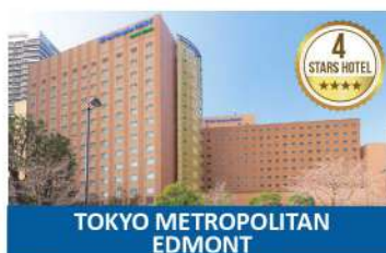
TOKYO METROPOLITAN EDMONT