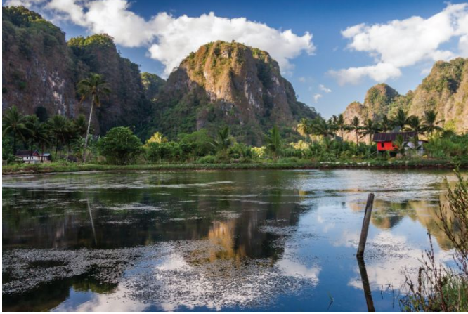
Rammang - rammang